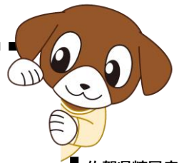
佐賀県糖尿病対策キャラクター「ナナ」ちゃん